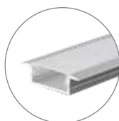
AP-2507-2 Perfil recto