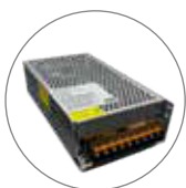
Fuente de poder a 24V