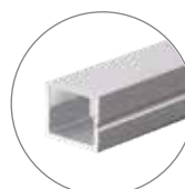
AP-1510-2 Perfil tira LED