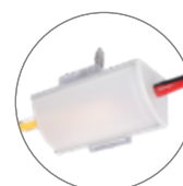
AP-1616-2 Perfil 90°